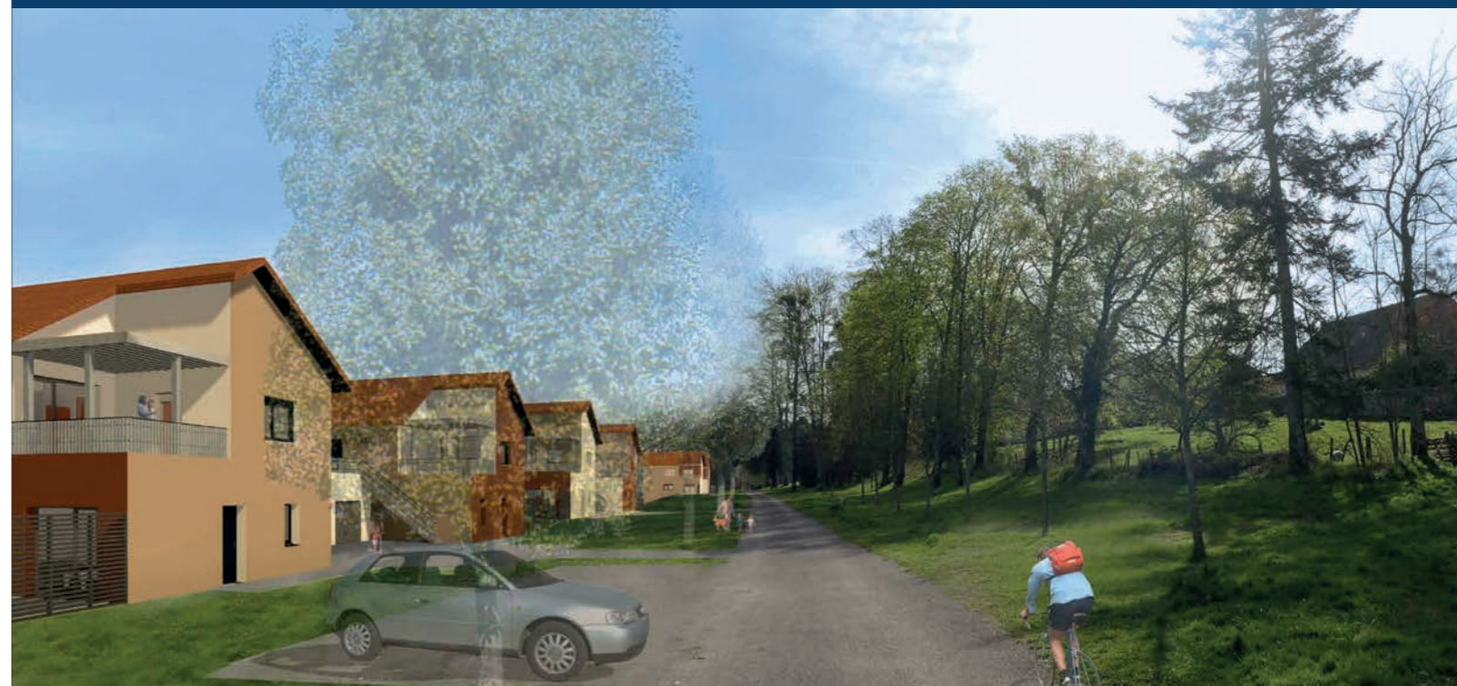
Service communication Néolia - Perspective et plan : ©Lamboley Architectes Office