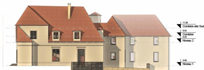
3 Élévation Sud Ech. 1 : 200